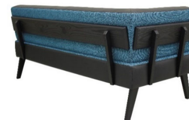
①2P右OA ②BK色 ③#7357 ④#6539